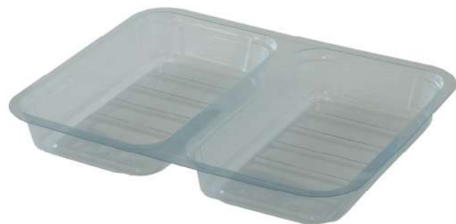
GA 35 GB PET

La sigilla e taglia vaschette STV, permette in una sola operazione il taglio + termo sigillatura delle vaschette doppio scomparto confezionate con il sistema SVG80, dividendo in due parti la vaschetta mantenendo al suo interno il gas protettivo. Questo piccolo accessorio è ideale per il confezionamento di formaggi, gastronomia e pasta fresca in ATM.